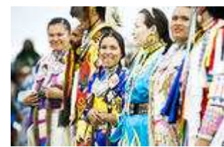
Vid pow-wow-festligheterna i Meadow Lake bär kvinnorna så här fina kläder.

Det ligger strax utanför samhället Meadow Lake och just den helgen när vi anländer pågår en årlig "pow-wow", ett färgstarkt firande och uppmärksammande av ursprungsbefolkningens traditioner med sånger, danser och maträtter.