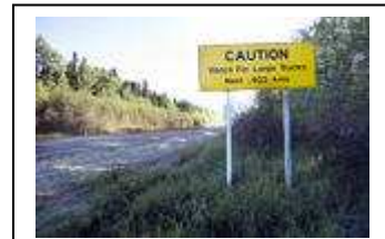
Vägskyltarna mellan Saskatoon och de glest befolkade delarna av norra Saskatchewan varnar för stora lastbilar, framför allt lastbilar som transporterar stora mängder uran från gruvområdena.

– Om någon påstår att det går att veta hur mycket uran en viss gruva serverar ett visst kärnkraftverk är